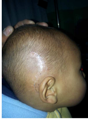
Binayak 10 Tage nach der OP