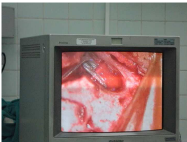
Elektrodeanordnung des Cochlea