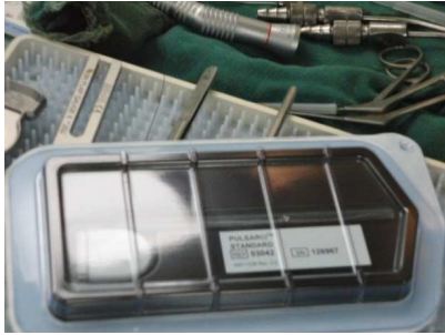
Das gespendete Cochlear Implantat.