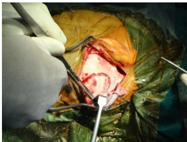
Vorbereitung für die Einsetzung