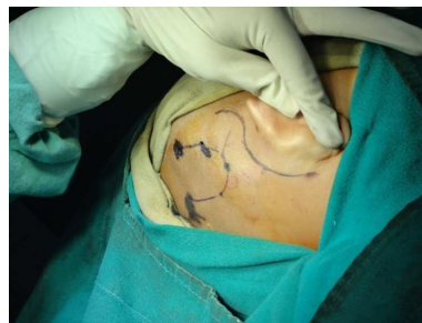
Markierung des Einschnitts